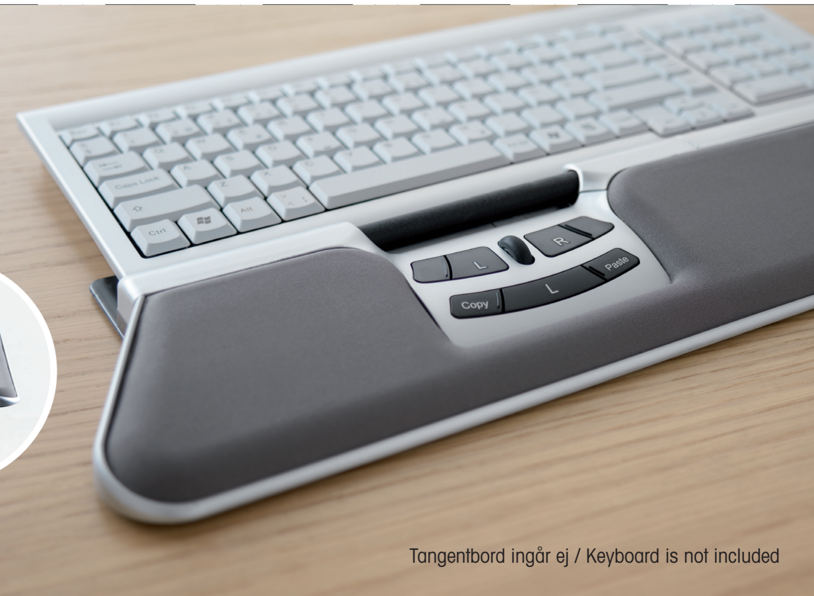
Tangentbord ingår ej / Keyboard is not included