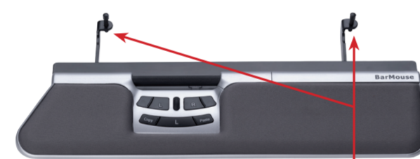
art nr 8055SI-LY + Konsoller H485